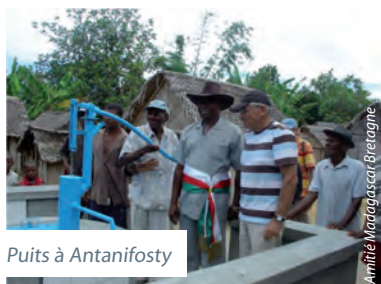
Puits à Antanifosty