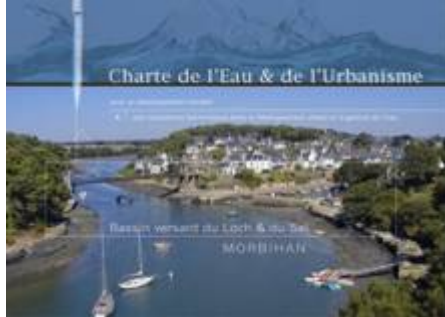
Démarche d'engagement des communes