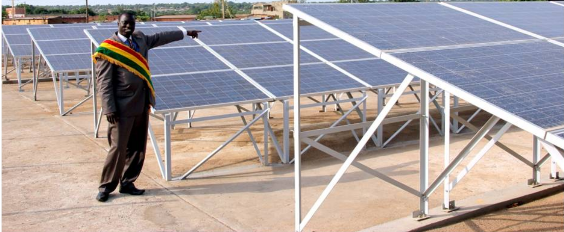
centrale électrique solaire à ouélessébougou