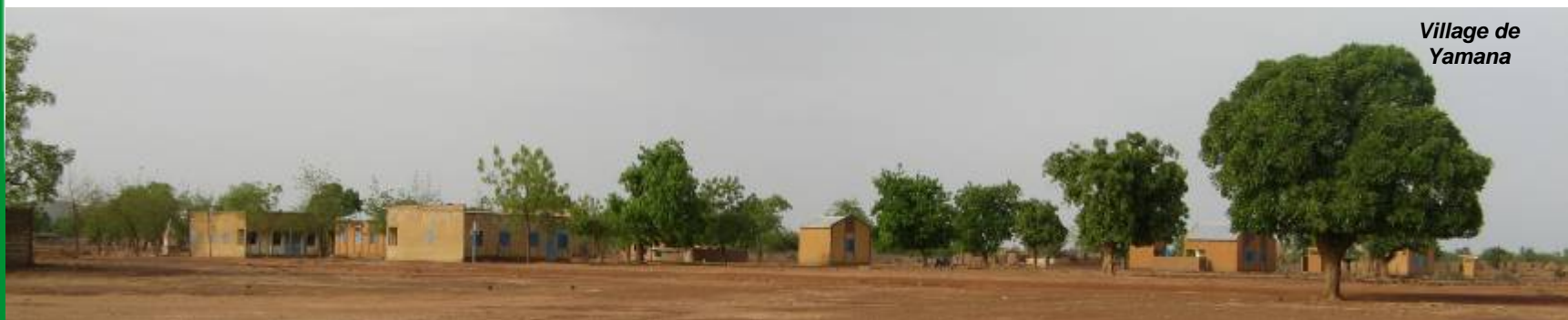
Village de Yamana

Partenariat de coopération décentralisée entre la Région du Plateau Central, le Réseau des communes de l'Oubritenga au Burkina Faso et la Région Limousin