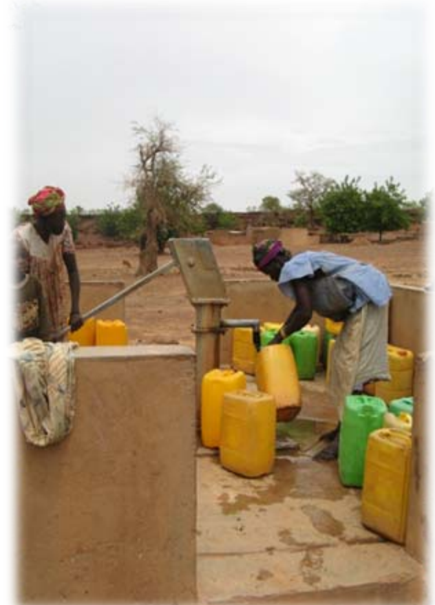
Forage à Pompe à Motricité Humaine sur la commune de Zitenga