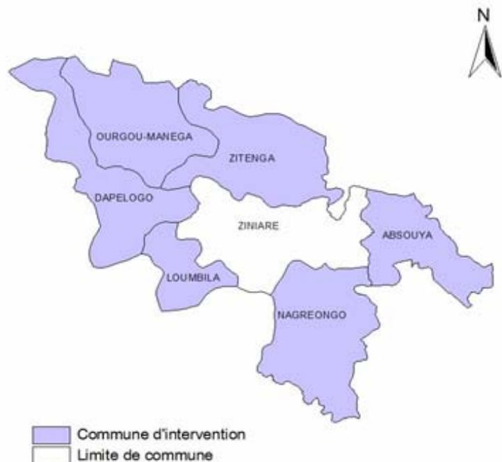
SITUATION GEOGRAPHIQUE DES COMMUNES D'INTERVENTION

Région du Plateau Central Province de l' Oubritenga