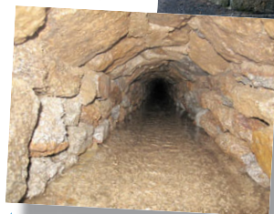
▲ Drain n°2 de Rennes 1 - Regard 163 vers amont