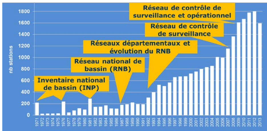
Quelques chiffres pour Loire Bretagne