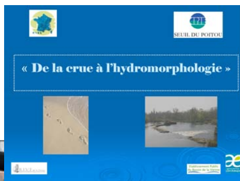
CPIE Seuil du Poitou