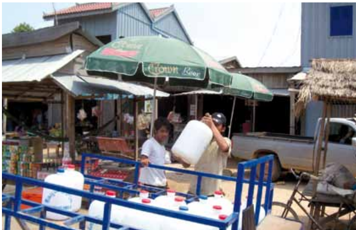
Livraison d'eau au Cambodge