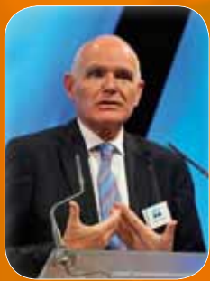
Serge Lepeltier Président du jury, président du comité de bassin

« Le comité de bassin va adopter très prochainement un projet ambitieux, le schéma directeur d'aménagement et de gestion des eaux, pour retrouver un bon état des eaux. Sa mise en œuvre va nécessiter une mobilisation de tous les acteurs de l'eau :