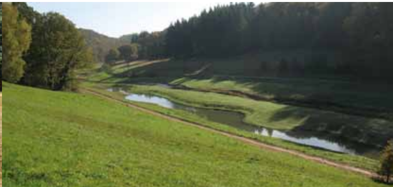
Et sur le site de Coupeau, le Vicoin redessine son lit