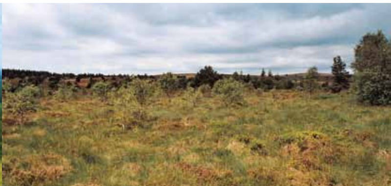
Les tourbières d'altitude de Gourgon-Bazanne