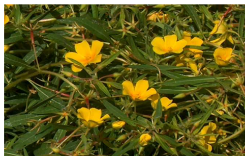
Jussie sur marais